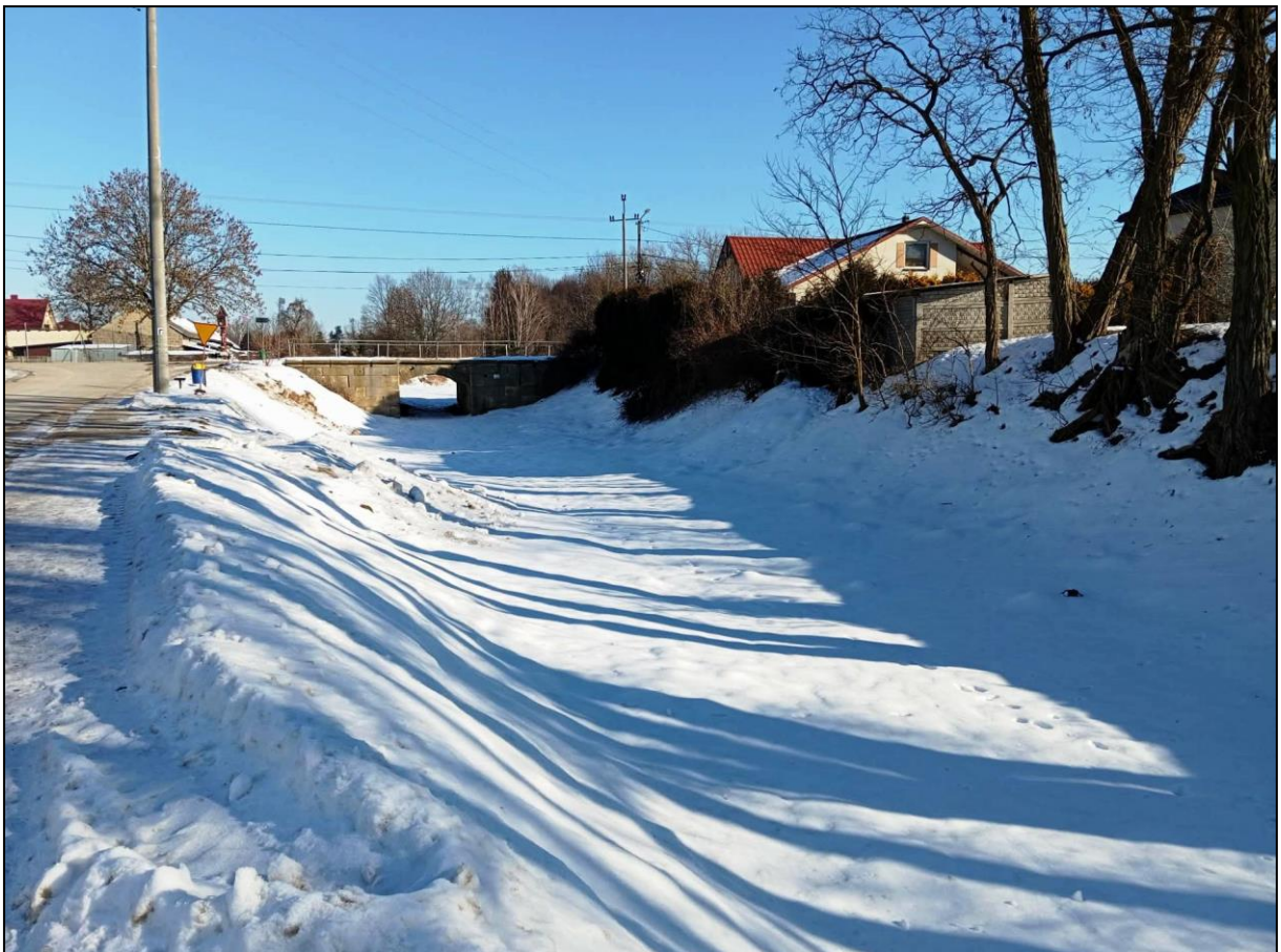
Most na kanale rzeki Świśliny