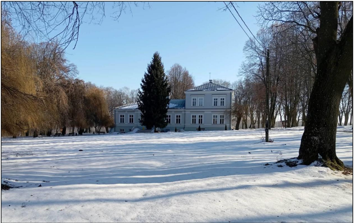
Dwór w Chocimowie