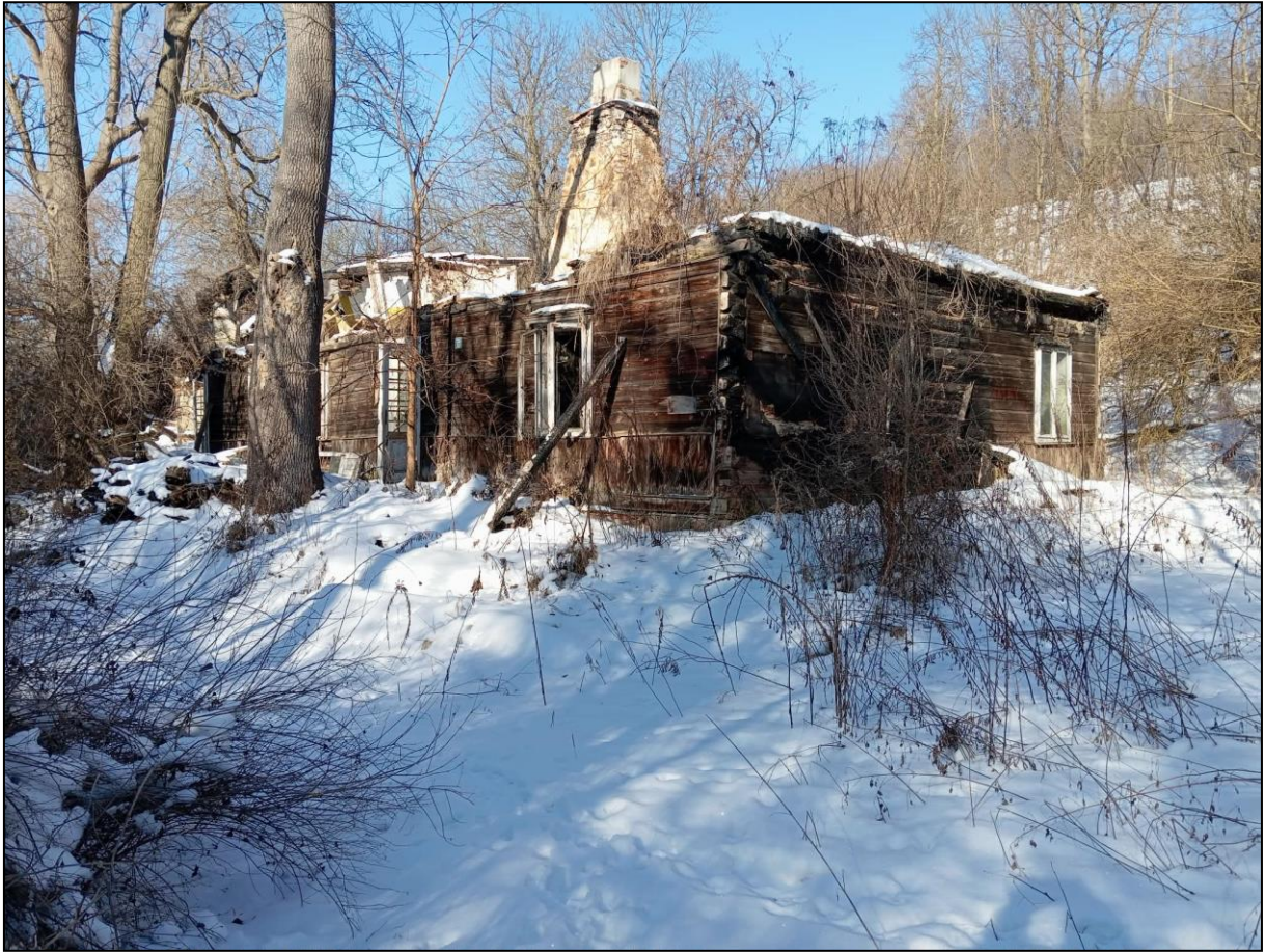
Dwór w Nietulisku Małym