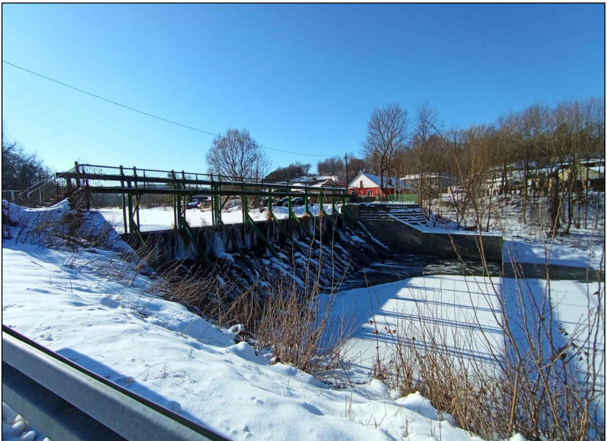
Jaz na rzece Świślinie