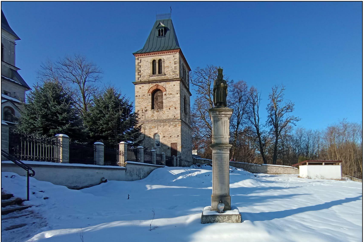
Widok na figurę św. Władysława i dzwonnice w Kunowie

W 1682 r. ks. Stanisław Kazimierz Sadowski, protonotariusz apostolski i kanonik kielecki, dobudował wieżyczkę. Około 1850 r., podczas probostwa ks. Jana Chryzostoma Dąbrowskiego, kościół przeszedł gruntowną restaurację, wyniku której został obniżony dach, a wieżyczkę zastąpiono nową, czworoboczną wieżą. W 1898 r. dobudowano kruchtę od strony północnej. Od schyłku XIX w. sylwetka kościoła nie uległa zmianie.