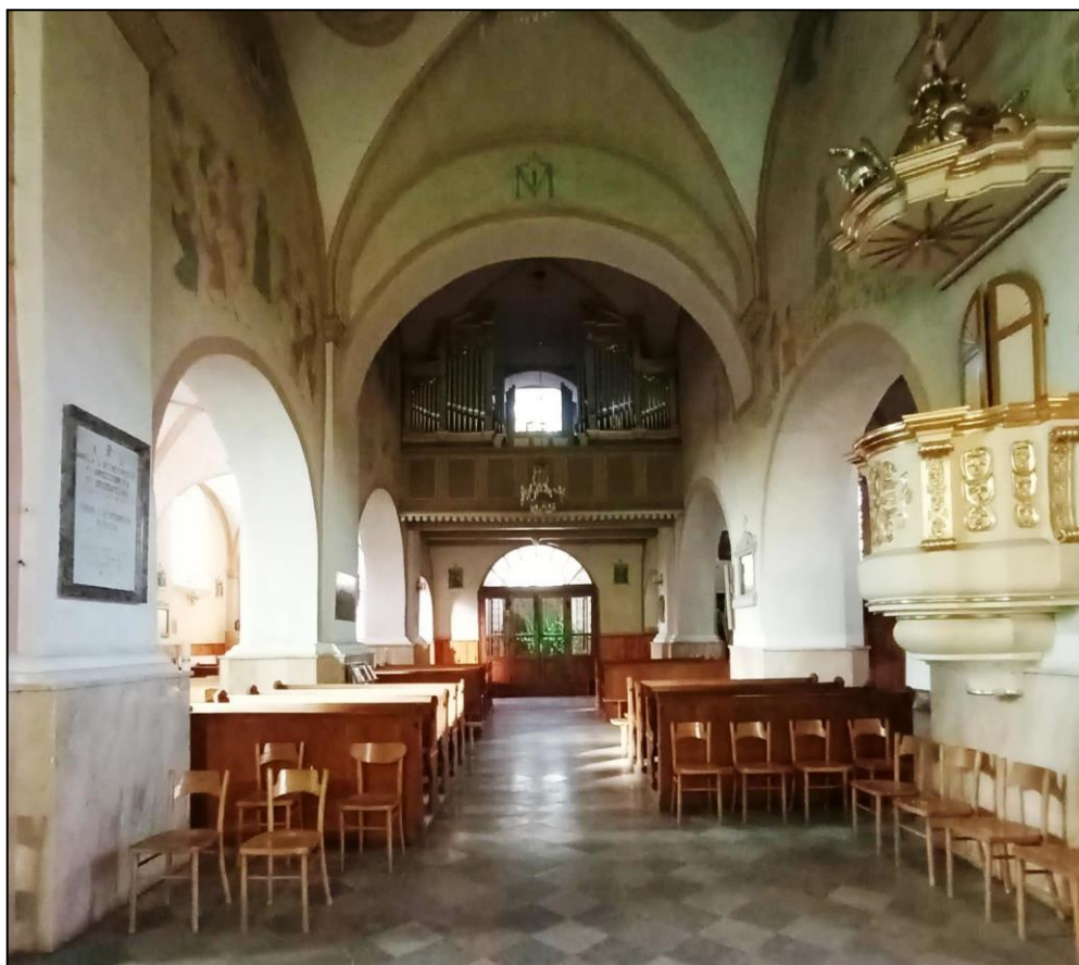
Widok na wejście główne i chór muzyczny kościoła w Kunowice