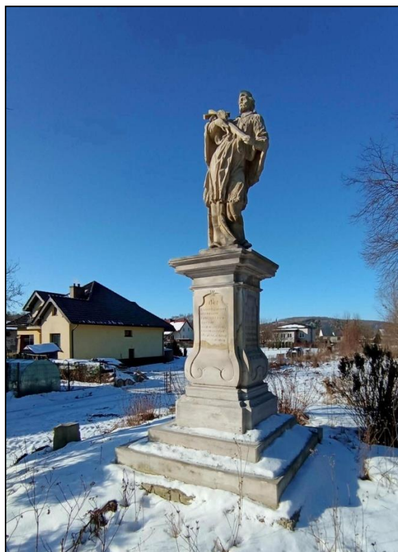
Figura św. Jana Nepomucena w Kunowie