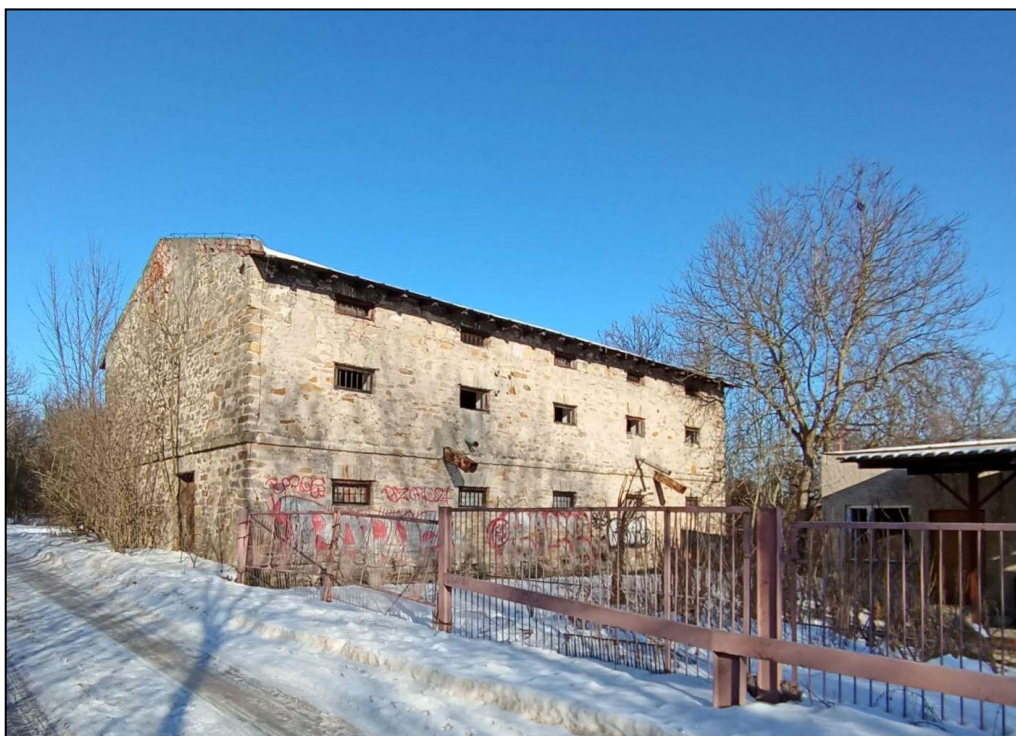
Spichlerz (młyn) w Kunowie

Wszystkie te zabytki nieruchome – od obiektów przemysłowych, przez dwory i parki, po układ urbanistyczny i cmentarze – tworzą spójną opowieść o historii, tradycji i gospodarczym rozwoju gminy Kunów. Dzięki nim mieszkańcy i turyści mogą poznać bogactwo kulturowe regionu, zrozumieć jego przeszłość oraz docenić związek człowieka z krajobrazem i zasobami naturalnymi.