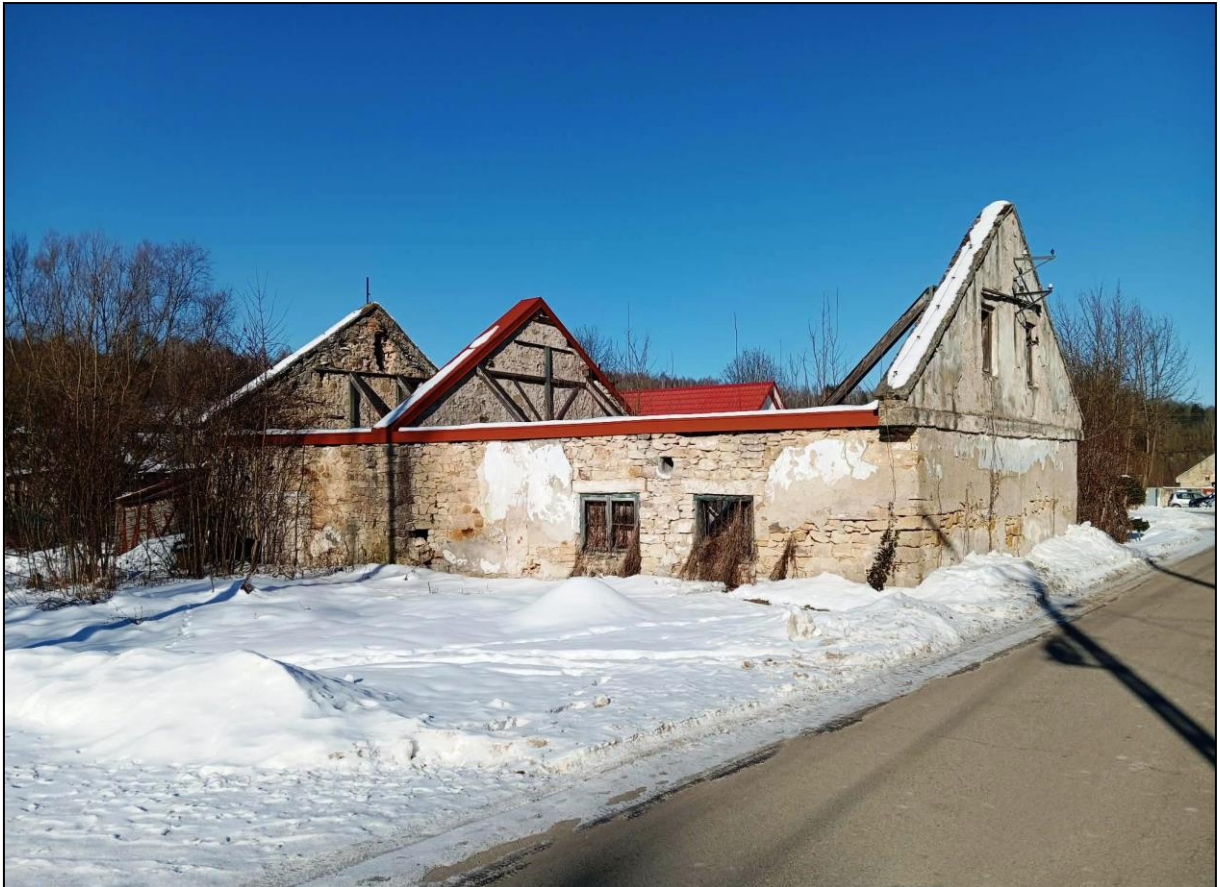
Budynek dawnych warsztatów kamieniarskich (garaże)