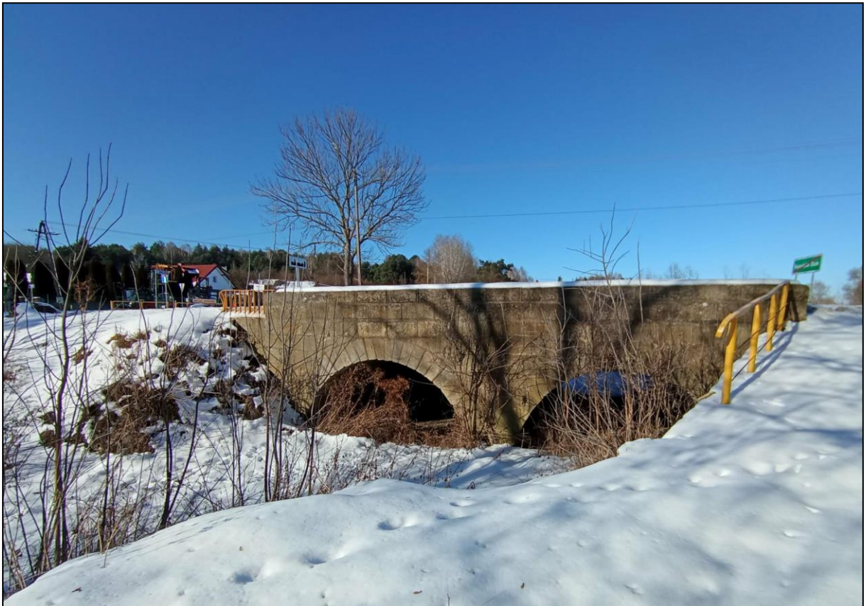
Most na kanale rzeki Kamiennej