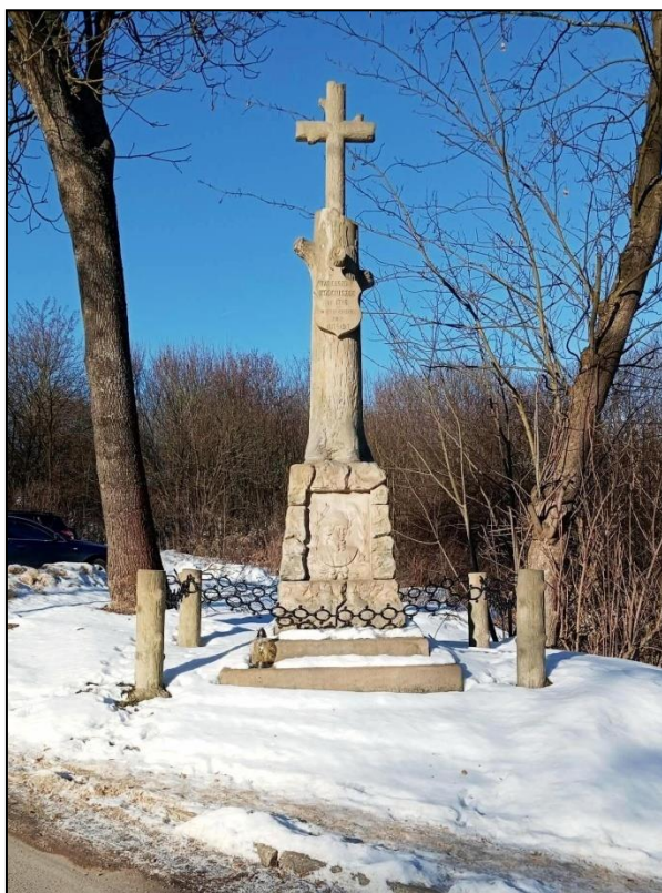
Krzyż poświęcony pamięci gen. T. Kościuszki w Kunowie

Kapliczki, krzyże, figury świętych stanowią nie tylko cenny element dziedzictwa kulturowego regionu, lecz także ważny symbol tożsamości lokalnej, łącząc w sobie wiarę, historię oraz tradycję przekazywaną z pokolenia na pokolenie.