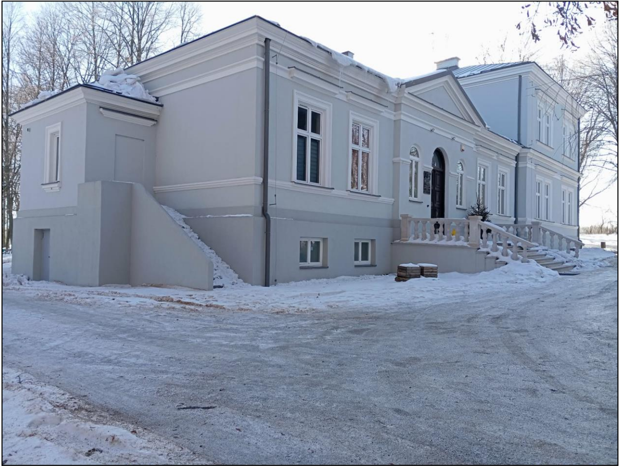
Dwór w Chocimowie