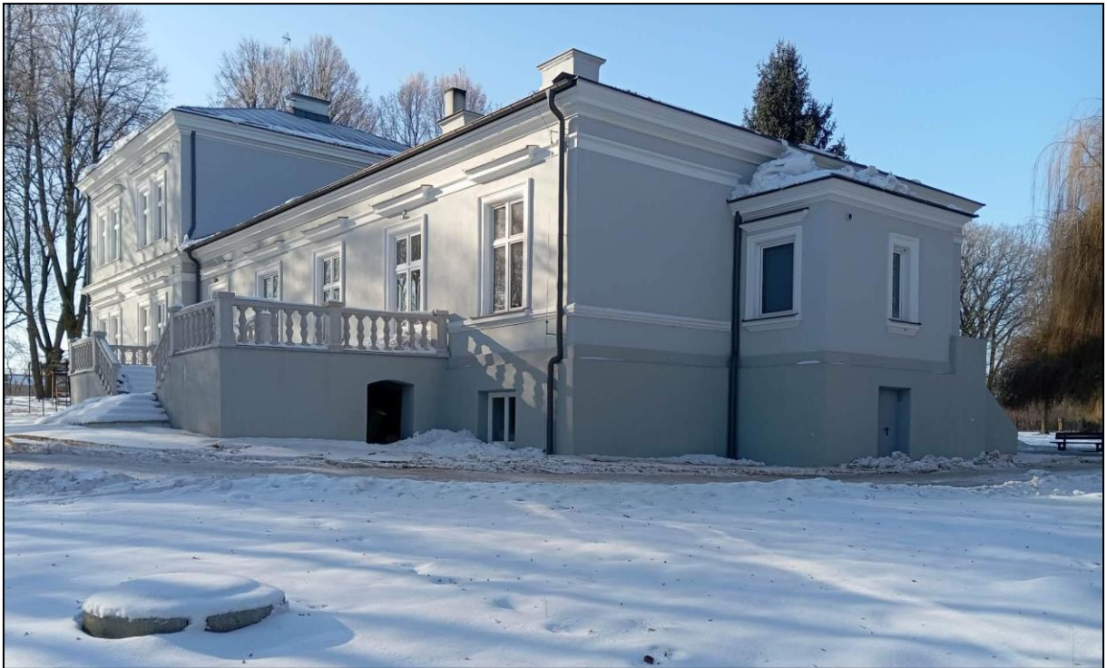
Dwór w Chocimowie