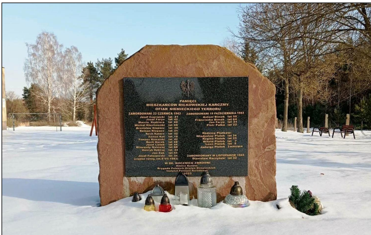
Pomnik pamięci ofiar niemieckiego terroru w Miłkowskiej Karczmy

Do miejsc pamięci narodowej na terenie gminy Kunów należą: