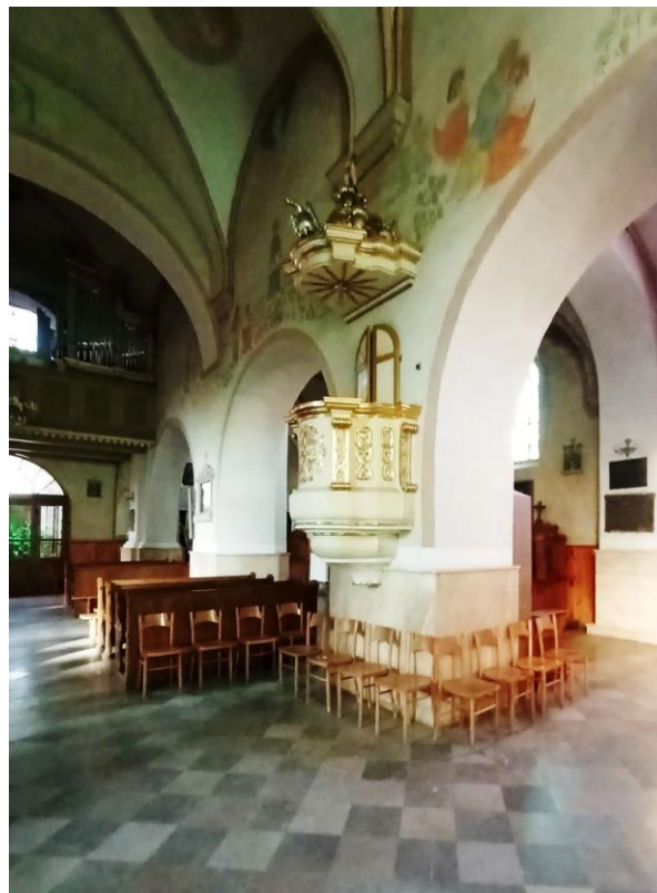
Wnętrze kościoła – widok na ambonę