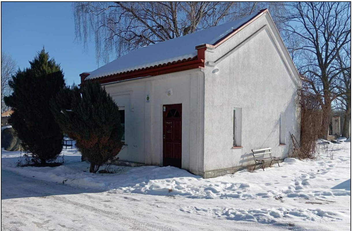
Budynek kontrolny II (wartownia)