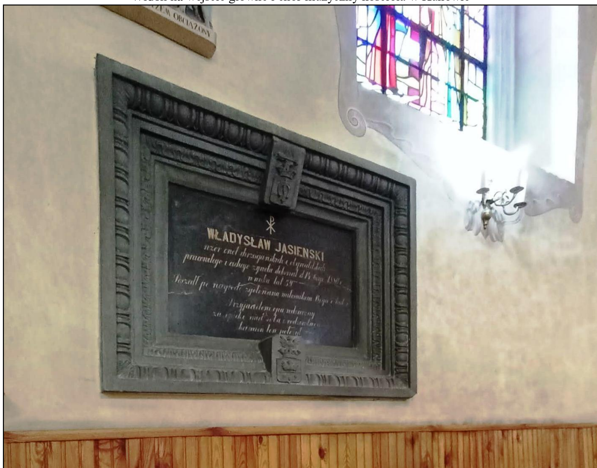
Tablica epitafijna Władysława Jasińskiego