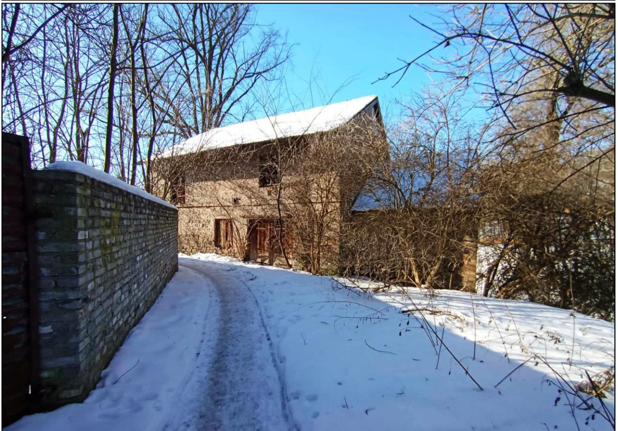
Młyn (magazyn żelaza) – elewacja wschodnia