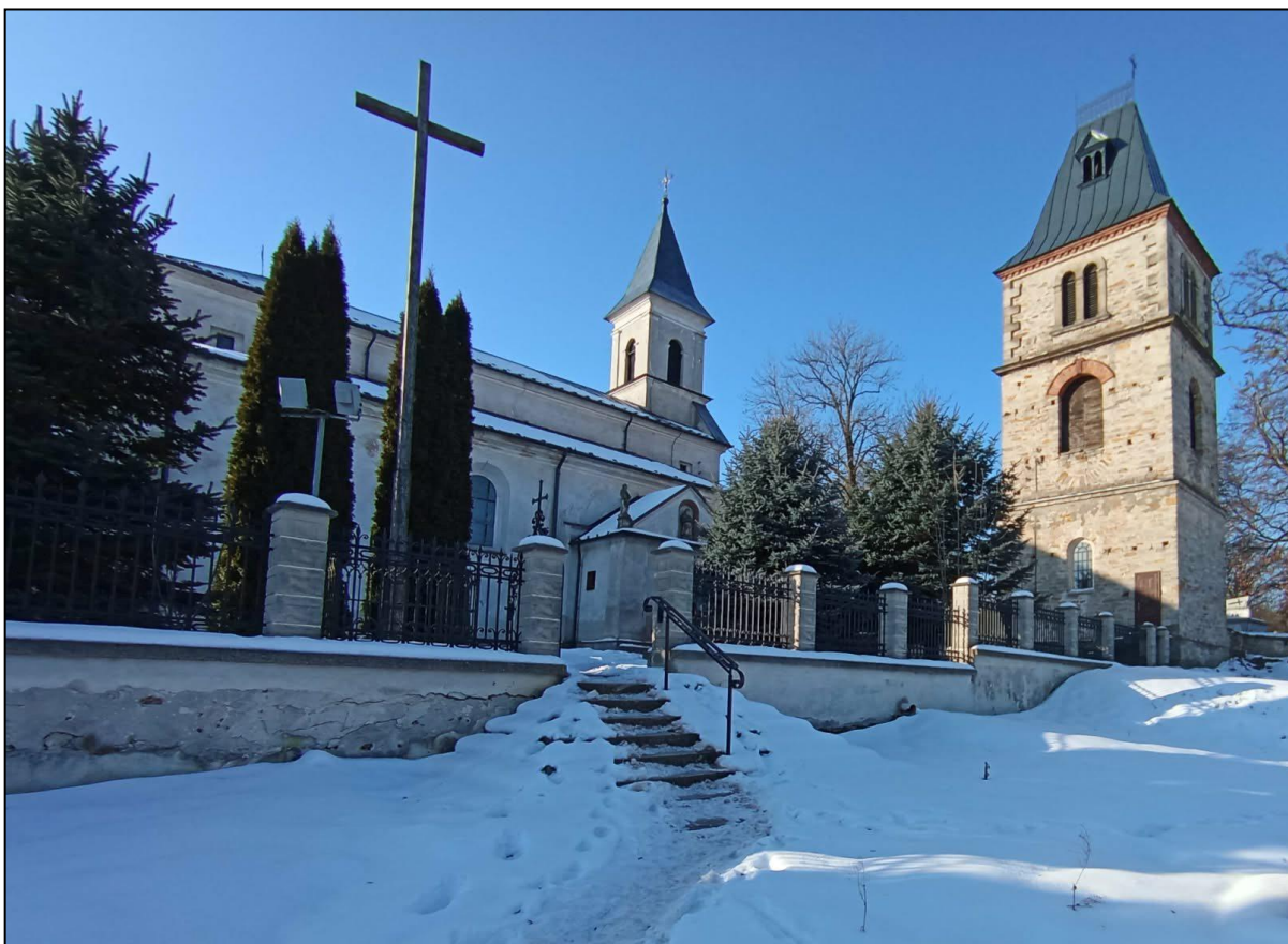
Widok na kościół i dzwonnice w Kunowie