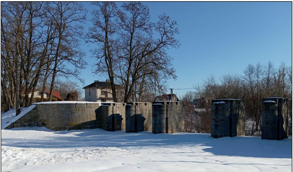
Jaz piętrzący – ulgowy na kanale świślińskim

Zabytki wskazane jako najważniejsze dla gminy Kunów wyróżniają się nie tylko metryką i walorami architektonicznymi, ale przede wszystkim wielowymiarowym znaczeniem – historycznym, kulturowym, krajobrazowym i tożsamościowym. Stanowią one świadectwo rozwoju osadnictwa, religijności oraz przemysłu na przestrzeni kilku stuleci, a jednocześnie posiadają istotny, wciąż niewykorzystany w pełni potencjał turystyczny. Ich obecny stan oraz