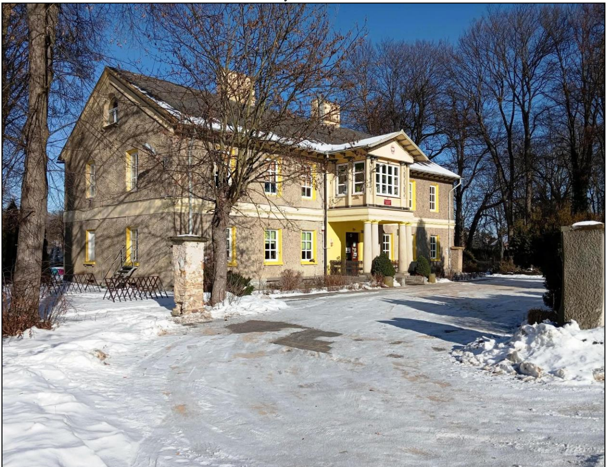
Budynek dyrekcji, ob. szkoła podstawowa