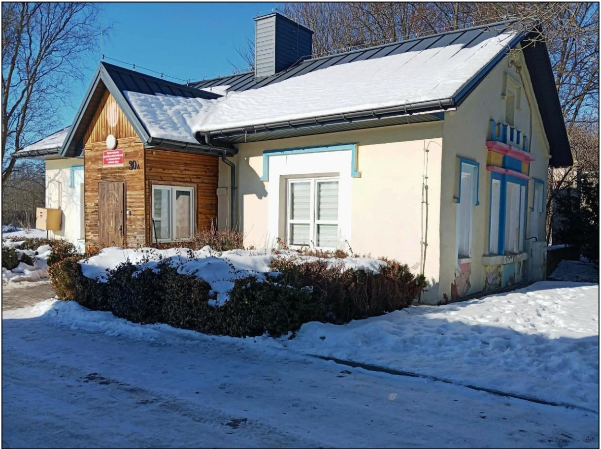
Budynek kontrolny, ob. przedszkole