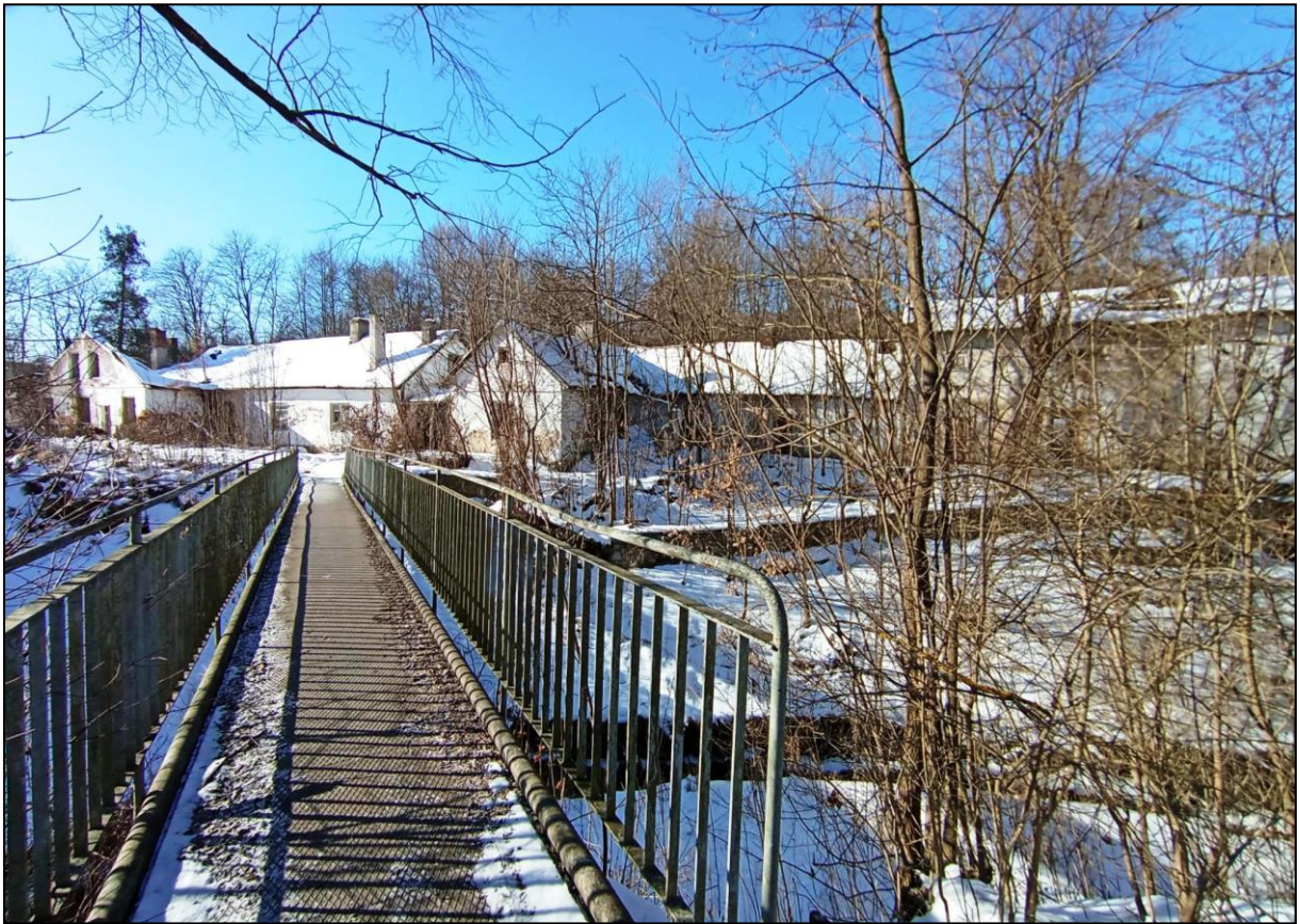
Budynek administracyjno-mieszkalny – widok na elewację wschodnią