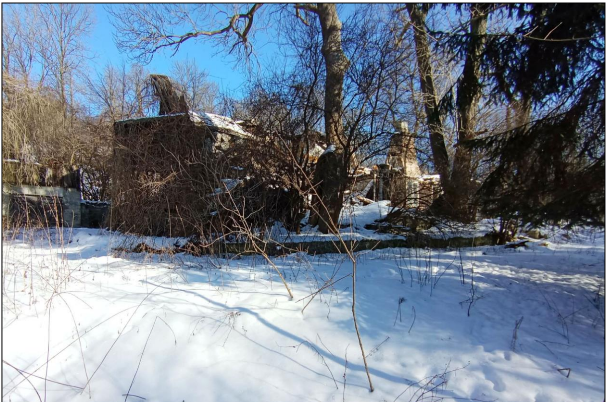
Dwór w Nietulisku Małym