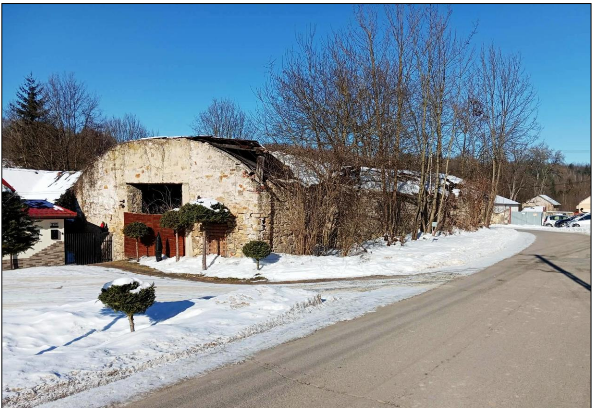
Budynek dawnych warsztatów kamieniarskich (magazyn)