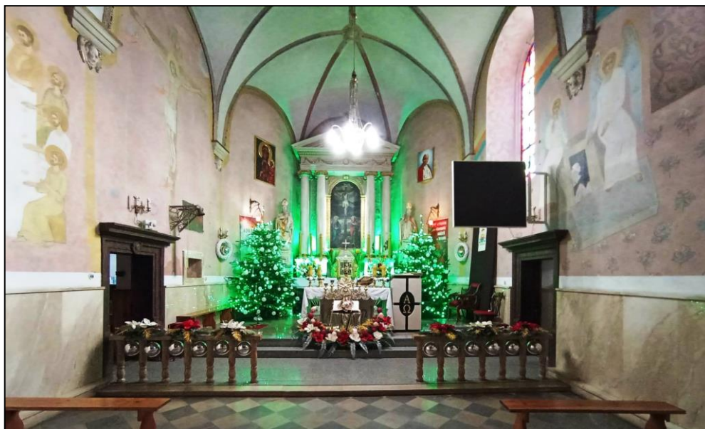
Widok ogólny na ołtarz główny kościoła w Kunowie

Na terenie gminy Kunów są zlokalizowane dwa cmentarze grzebalne. Tym, który słynie z nagrobków i pomników cmentarnych o wartościach artystycznych i historycznych jest cmentarz w Kunowie założony w 1810 r.