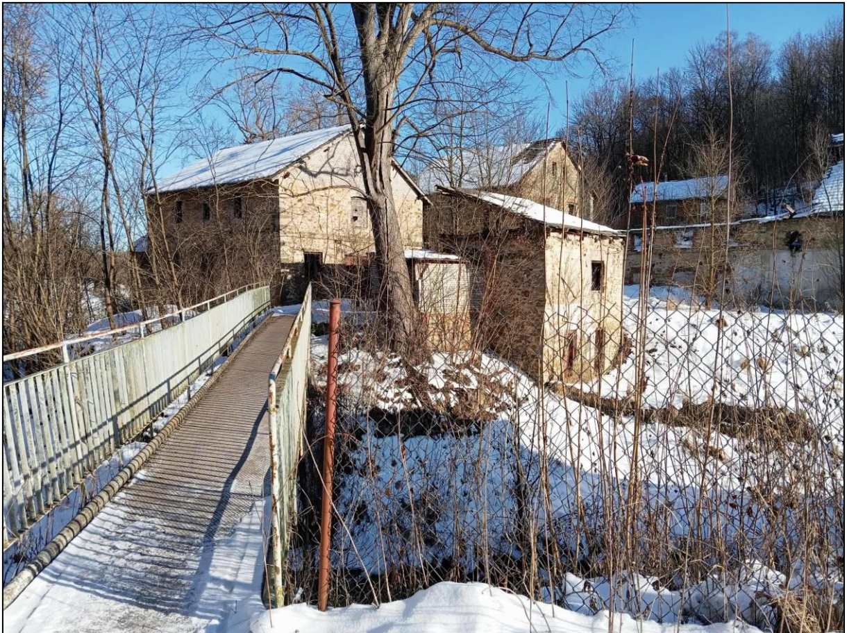
Widok na dawne młyny (magazyn żelaza, magazyn wyrobów gotowych i magazyn techniczny) i rechlownię